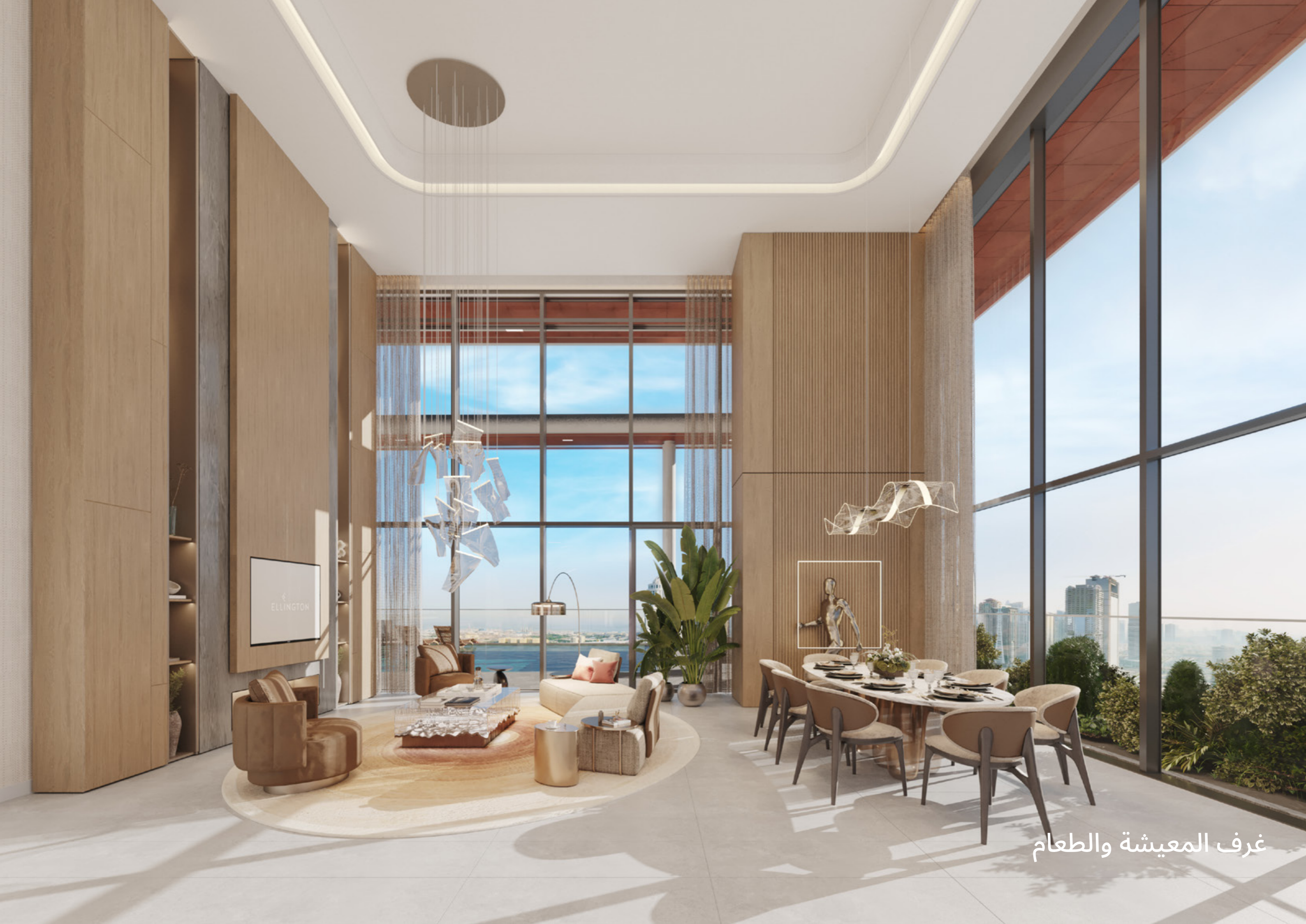
غرف المعيشة والطعام